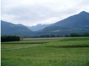
PLANCHE DE PHOTOGRAPHIE ET DE FIGURES