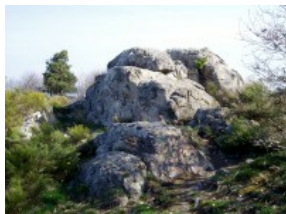
PLANCHE DE PHOTOGRAPHIE ET DE FIGURES